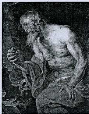
«San Jerónimo penitente», de Van Dyck. Museo del Prado

► San Jerónimo, homenajeado en una exposición con el sello de Eduardo Arroyo